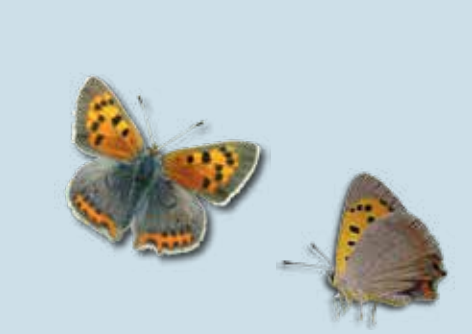
kleine vuurvlinder mei - okt