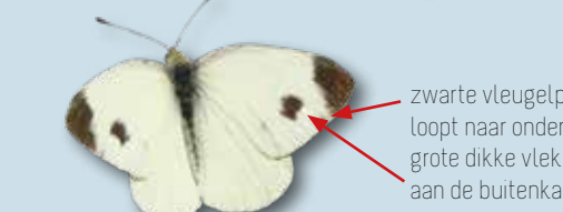
scheefbloemwitje april - okt