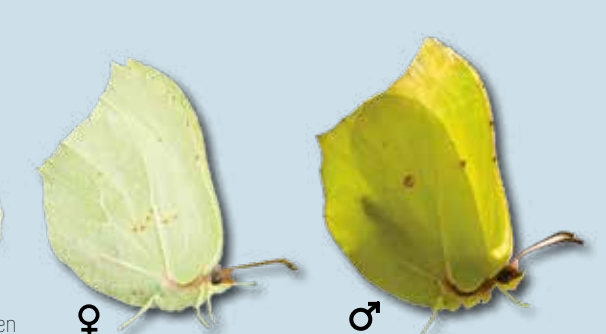
citroenvlinder maart - oktober