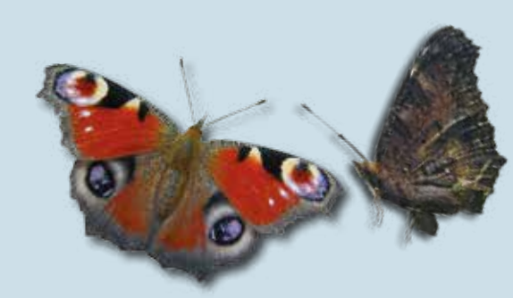
dagpauwoog maart - sept