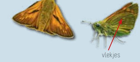
zwartsprietdikkopje juli - aug