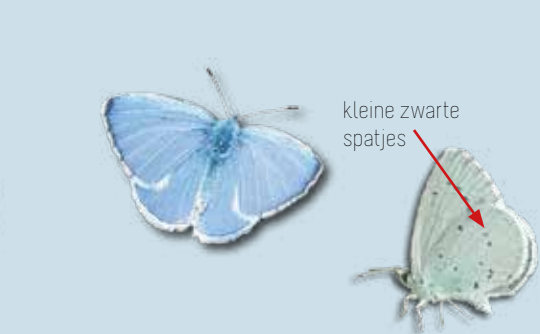
boomblauwtje april - sept