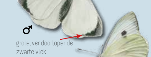
grote, ver doorlopende zwarte vlek