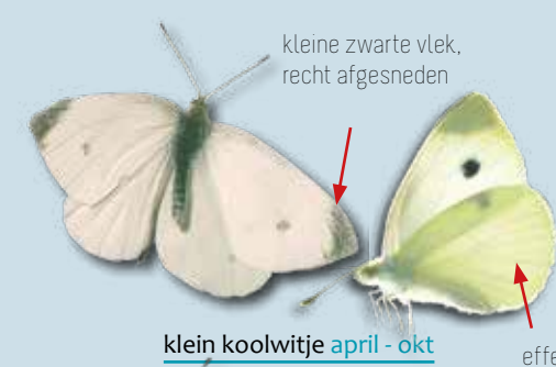
klein koolwitje april - okt