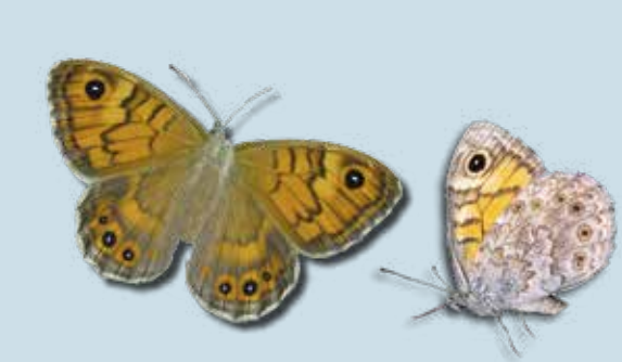
argusvlinder mei - sept