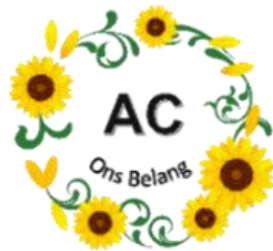
Foto van de Maand